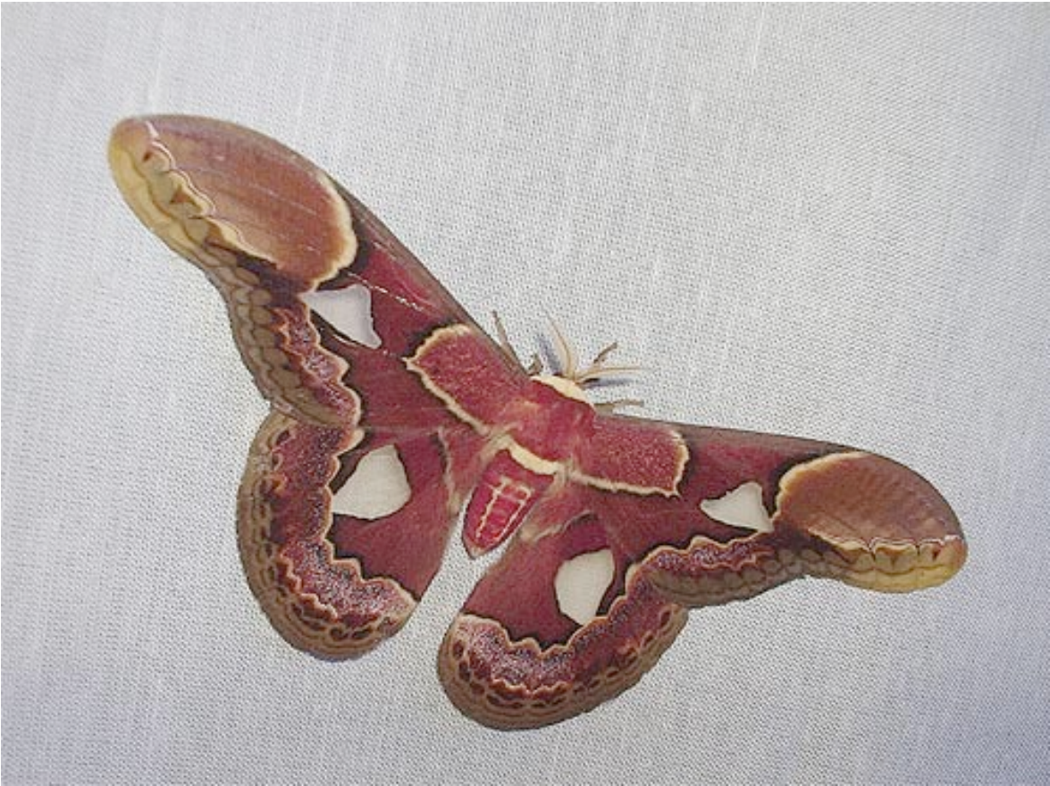
Mariposa nocturna Rotschildia erycina